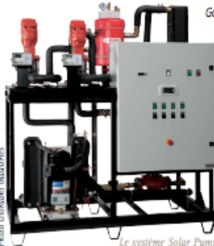
Le système Solar Pump pour la production d'eau chaude solaire

"Les perspectives du chauffage solaire sont très prometteuses et le monde de l'énergie est actuellement en plein bouleversement avec l'épuisement des ressources pétrolières et les dangers du nucléaire, remis en avant par les événements dramatiques au Japon", indique la présidente. La nouvelle norme RT2012 impulsée par le Grenelle de l'environnement, qui s'imposera dès fin 2011 aux bailleurs sociaux, est également une aubaine pour ce groupe pionnier des énergies solaires. "En 2011, l'activité devrait être stable car nous absorberons la fin de la crise et les conséquences de la politique de stop and go du